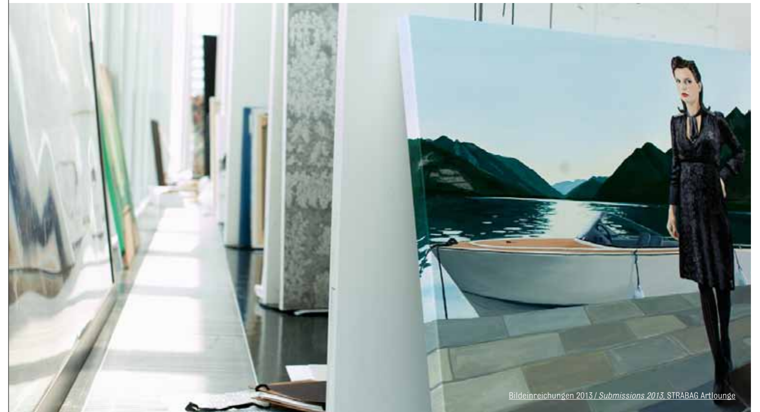
Bildeinreichungen 2013 / Submissions 2013, STRABAG Artlounge