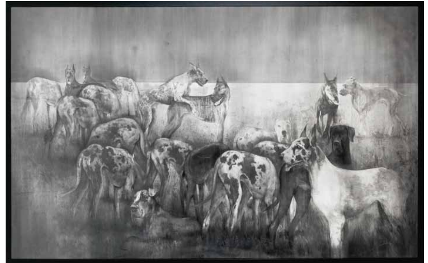
DOWN HERE AT THE FARM 01 Grafit auf Papier / graphite on paper , 130 x 220 cm, 2012