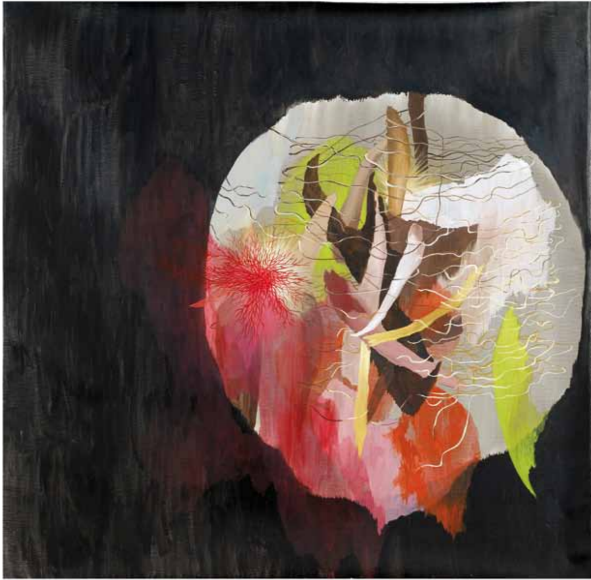
ORGANISM 15 Öl auf Leinwand / oil on canvas , 160 x 160 cm, 2012