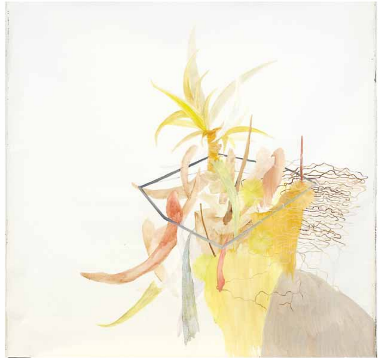
ORGANISM 18 Öl auf Leinwand / oil on canvas , 160 x 160 cm, 2012