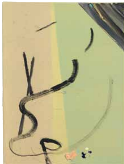
LUCKY AND UNHAPPY Öl und Lack auf Molino / oil and lacquer on molino , 40 x 30 cm, 2012