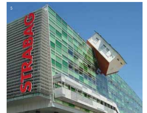
1) Gironcoli-Kristall / Gironcoli Sculpture Hall, STRABAG Headoffice 2) Skulptur von Bruno Gironcoli / sculpture of Bruno Gironcoli, vor / in front STRABAG Headoffice 3) Sitzungszimmer / meeting room, STRABAG Headoffice