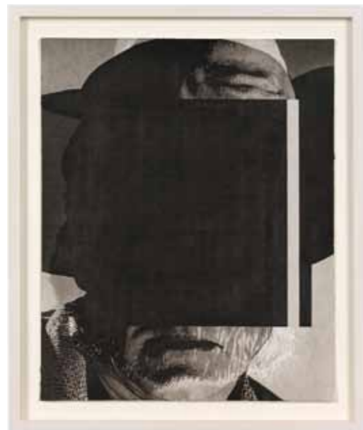
OHNE TITEL (BILL) Tusche auf Papier / ink on paper , 30 x 24 cm, 2013