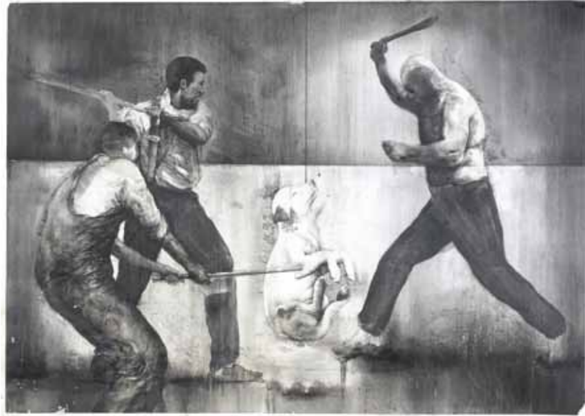
DOWN HERE AT THE FARM 02 Grafit auf Papier auf Holz / graphite on paper mounted on wood , 65 x 92 cm, 2012