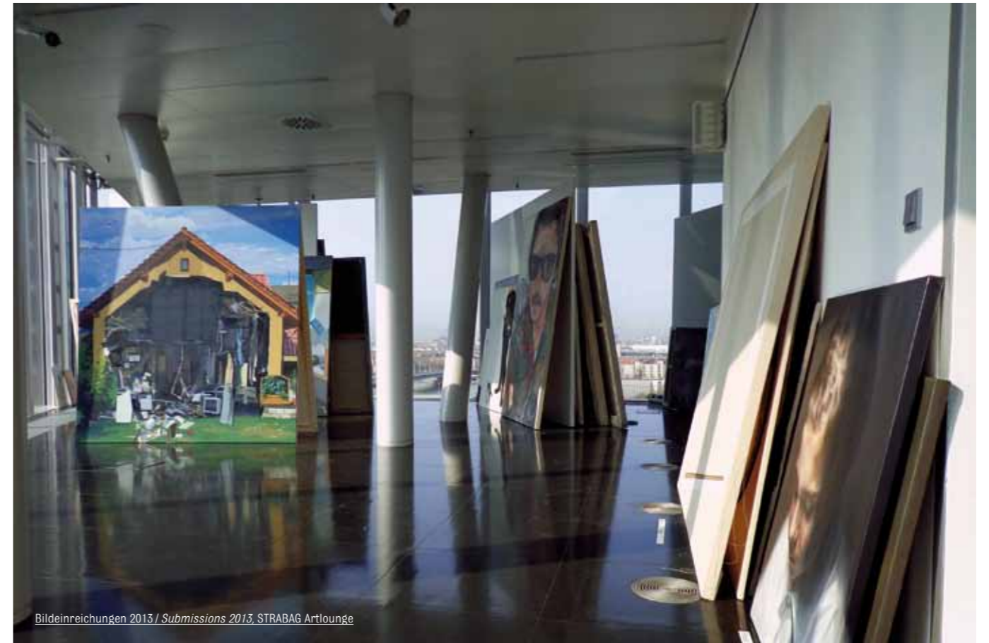
Bildeinreichungen 2013 / Submissions 2013, STRABAG Artlounge

Die alle drei Jahre wechselnde Jury tagte 2013 zum zweiten Mal in dieser Zusammensetzung. Das Betrachten, Vergleichen und in Bezug setzen der Originale diente dazu, den Charakter der jeweiligen Werke intensiv und direkt zu erfassen und die Qualität der Arbeiten zu überprüfen.