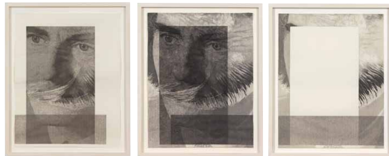
OHNE TITEL (OBLONG) Sepia und Tusche auf Papier / sepia and ink on paper , 38 x 29,5 cm each, 2013