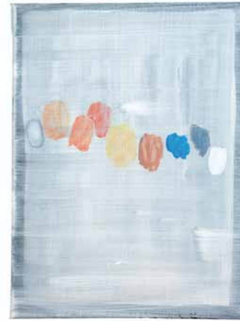
UNTITLED Öl, Acryl auf Leinwand / oil, acrylic on canvas , 40 x 30 cm, 2013