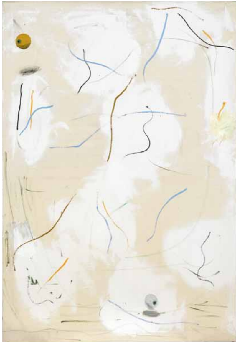
HOW TO LOOK AT AN ABSTRACT PAINTING

Öl auf Molino, Hasenleim, Grundierung / oil on molino, rabbit-skin glue, primer , 130 x 90 cm, 2012