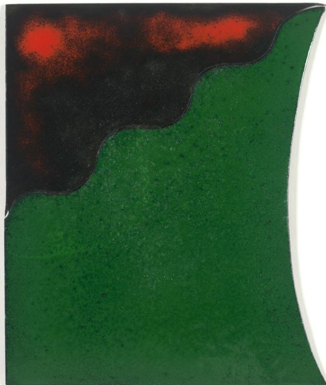
Ohne Titel. Emaille auf Kupfer, 20 x 16,7 cm, 2017.

Atelierstipendium der Karl-Hofer-Gesellschaft, Berlin, DE