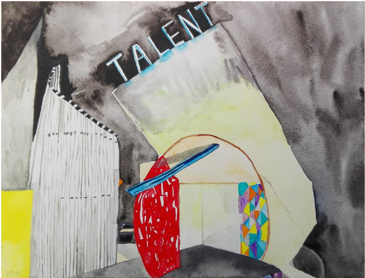
Talent (Revolver der Überschüsse, Bühnenbild: Janina Audick, 2013, René Pollesch, Schauspiel Stuttgart). Aquarell, 24 x 32 cm, 2016.