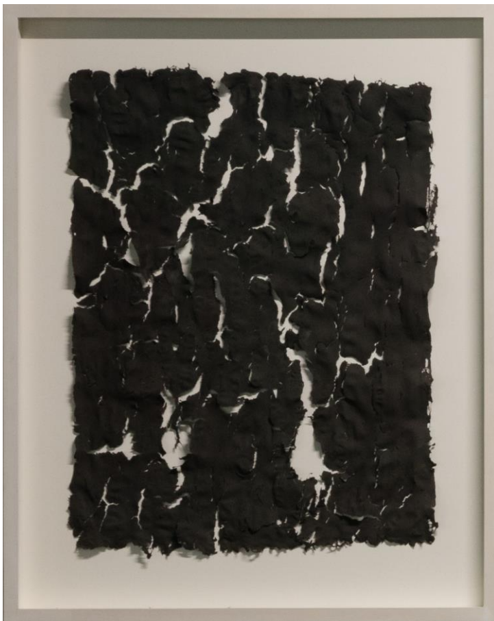
Neckartorschwarz No.4. Feinstaub-Relief, 90 x 60 x 5 cm, 2016. Foto: Frank Kleinbach

reFORM, Preisträger des Wettbewerbs der evangelischen Landeskirche, Stuttgart, DE