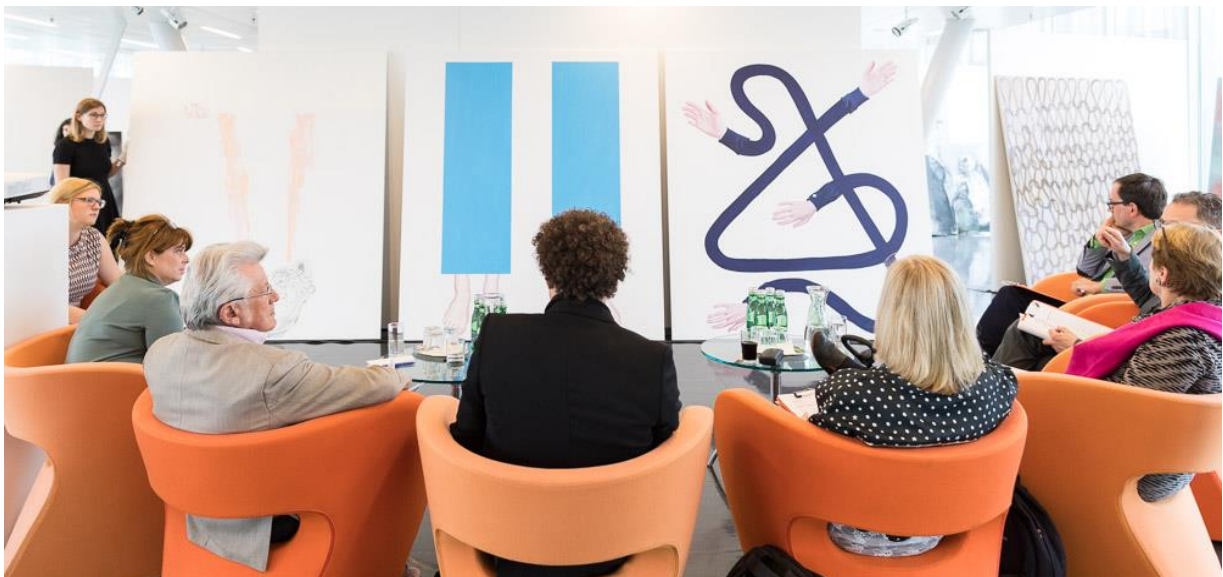
Jurysitzung im April 2018 in der STRABAG Artlounge im STRABAG Haus