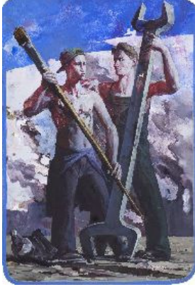
untitled,,Acryl auf Karton, acrylic on cardboard, 55x38 cm, 2010