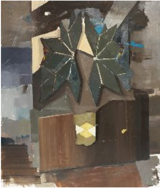
untitled, Öl auf Leinwand, oil on canvas, 200x170 cm, 2011