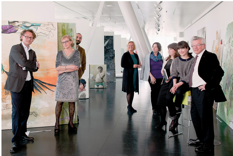
Strabag Artlounge, Vienna; Jury 2012

The Strabag Artaward International art subsidy prize of Strabag SE for painting and drawing is one of the largest grants from an Austrian company for the visual arts. It is to be understood as a recognition for outstanding individual artistic performance and is intended for the younger generation of artists up to the age of forty who seek to bring their works closer to an audience from the worlds of art and economics. After the award ceremony and a group exhibition of the winning works, each of the five chosen artists will present their works in an individual exhibition at the Artlounge in the Vienna Strabag Building. Acquisitions for the collection will be made and the award-winning artists are then invited to stay as artists-in-residence at the Strabag Artstudio in the Vienna Strabag Building