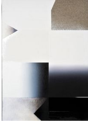
untitled, Öl auf Leinwand, oil on canvas, 90x65 cm, 2011