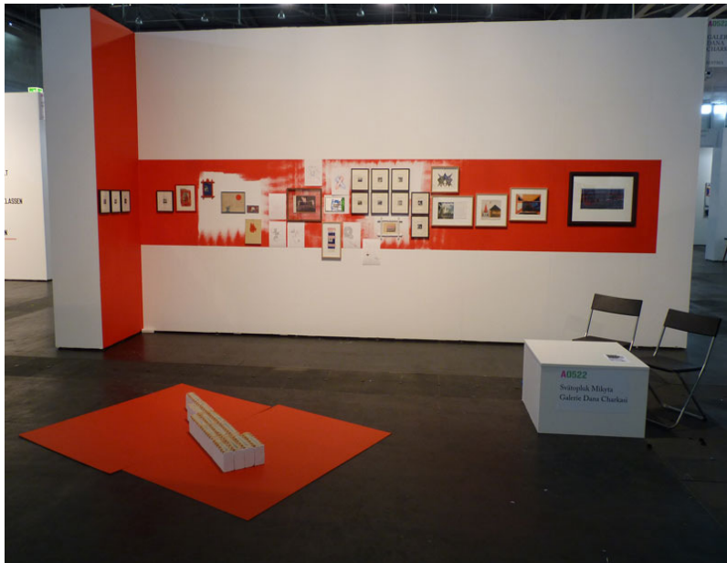
Svätopluk Mkyta, Installation, Galerie Dana Charkasi, Viennafair 2011