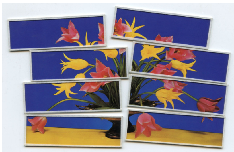
Fallendes Stilleben, 2009, Collage

Ausstellungsdauer / Exhibition : 09.03. - 06.04.2012