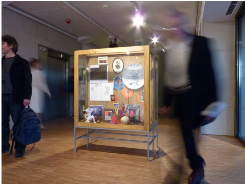
Svätopluk Mkyta, No contemporary story II, Contemporary Art Gallery, Nowy Sacz, Poland, 2011