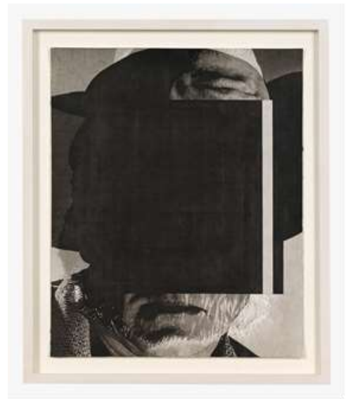
Ohne Titel (Bill), Tusche auf Papier / ink on paper, 30 x 24 cm, 2013

2013 wurde zum fünften Mal der STRABAG Artaward International ausgeschrieben. Nach einem Dreijahreszyklus mit den Teilnahmeländern Österreich, Slowakei, Tschechien und Ungarn können sich in den Jahren 2012-2014 junge Künstlerinnen und Künstler aus Österreich, Polen, Rumänien und Russland bewerben. Der spannende Einblick in die junge Szene Europas mit den abwechslungsreichen Ausstellungen der neuen Preisträgerinnen und Preisträger bereichert das Programm des STRABAG Kunstforums und eröffnet den Besucherinnen und Besuchern ein neues Kunstfeld.