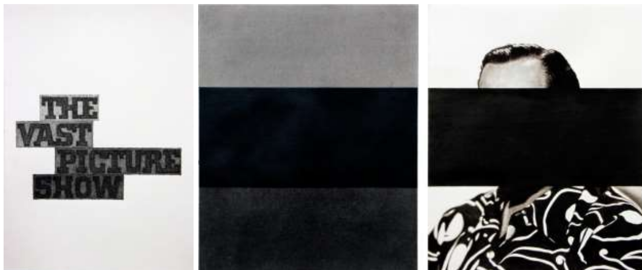
o.T.(mark), tusche auf papier, 2 teilig, je 30x24cm, 2013