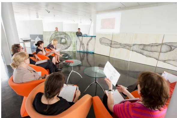
Jury 2014, STRABAG Artlounge

Der spannende Einblick in die junge Szene Europas mit den abwechslungsreichen Ausstellungen der neuen Preisträgerinnen und Preisträger wird das Programm des STRABAG Kunstforums im Kunstjahr 2014/15 bereichern und den Besuchern des STRABAG Kunstforums ein neues Kunstfeld eröffnen.